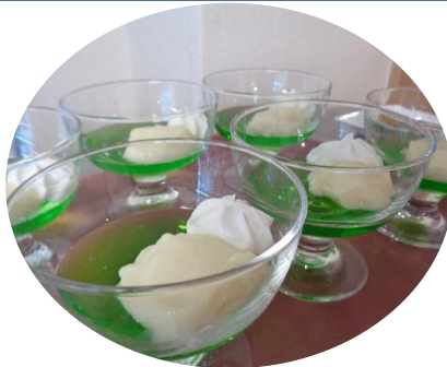
選べる喫茶の手作りメロンゼリー